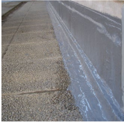
Seinäliitokset ja piippujen tyvet