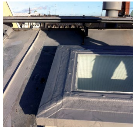
Kattoikkunat ja lasikatteet