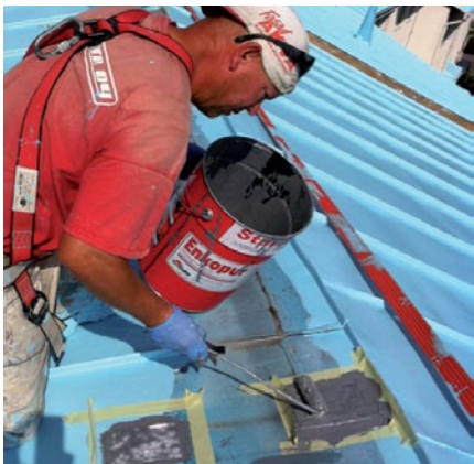
Reiät ja kulkusilta- ja lumi-estekiinnitykset