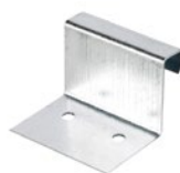
JL klammeri 0,50/0,60